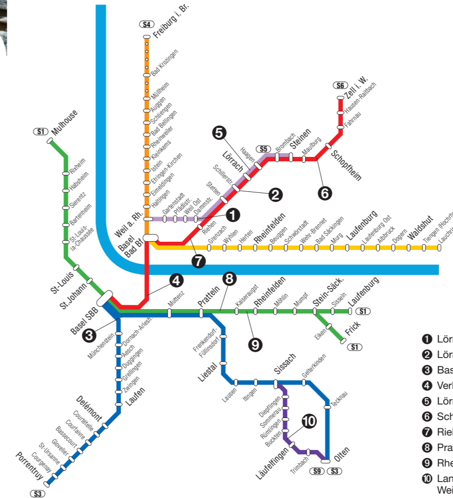
Der Liniennetzplan 2008: (Stand Januar 2005)